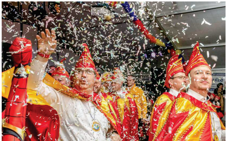
Neben Musik, Tanz und guter Laune dürfte auch Konfetti nicht fehlen, wie die Narren vom 1. Tagewerbener Carnevalsverein bei ihrem Gala-Abend am Freitag zeigten.