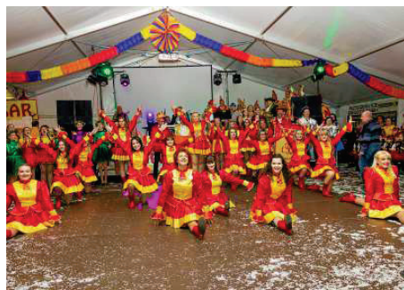
Die TCV-Garde, die Prinzengarde und die Funkengarde haben den Gala-Abend am Freitag in Tagewerben gemeinsam mit einem Tanz eröffnet.