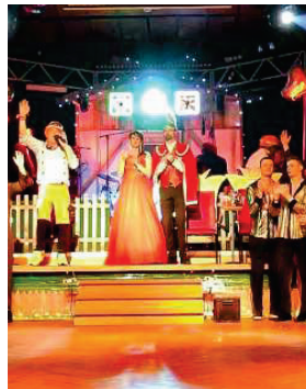
Prinzessin Tina I. und Prinz Christian I. sind das diesjährige Prinzenpaar beim VfB Scharnhorst Großgörschen 1932.